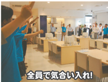
全員で気合い入れ！

京都の伝統行事「地蔵盆」と重なってしまいましたが、そんな中たくさんのお客さんに来ていただきました！本当にありがとうございました！！