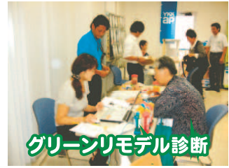
グリーンリモデル診断

ほかにもフラワーアレンジメント教室やアロマテラピー、屋台村などなど、お楽しみ企画がもりだくさん。来ていただいた方には、きっと楽しんでいただけたのではないかなと思います。