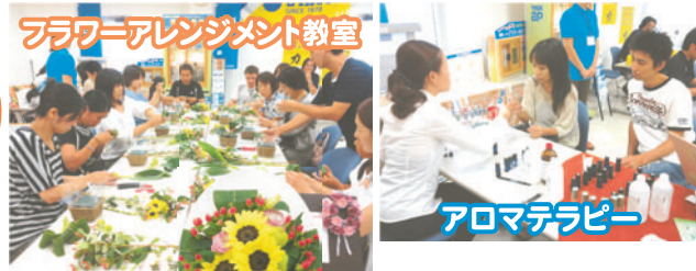
フラワーアレンジメント教室